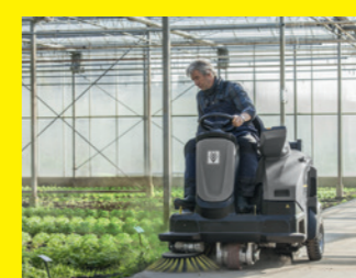
Kehr- und Kehrmaschinen