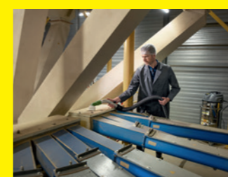
Silo-Sauger IVM 40/24-2 M ACD Adv Farmer