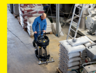
Multifunktions-Flächensauger NT 75/2 Tact² Adv Farmer