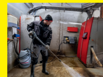
Stationäre Melkstandreiniger HD 10/21 und HD 13/18-4 S St Classic Plus Farmer