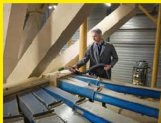
Silo-Sauger IVM 40/24-2 M ACD Adv Farmer