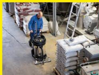
Multifunktions-Flächensauger NT 75/2 Tact² Adv Farmer