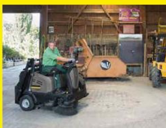
Kehr- u. Kehrsgasmaschinen